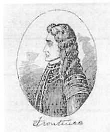
BUADE, LOUIS DE, comte de FRONTENAC et de PALLUAU