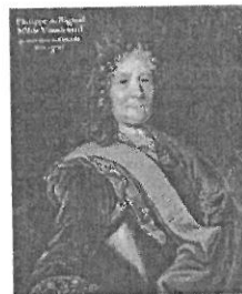
RIGAUD DE VAUDREUIL, PHILIPPE DE, marquis de Vireuil