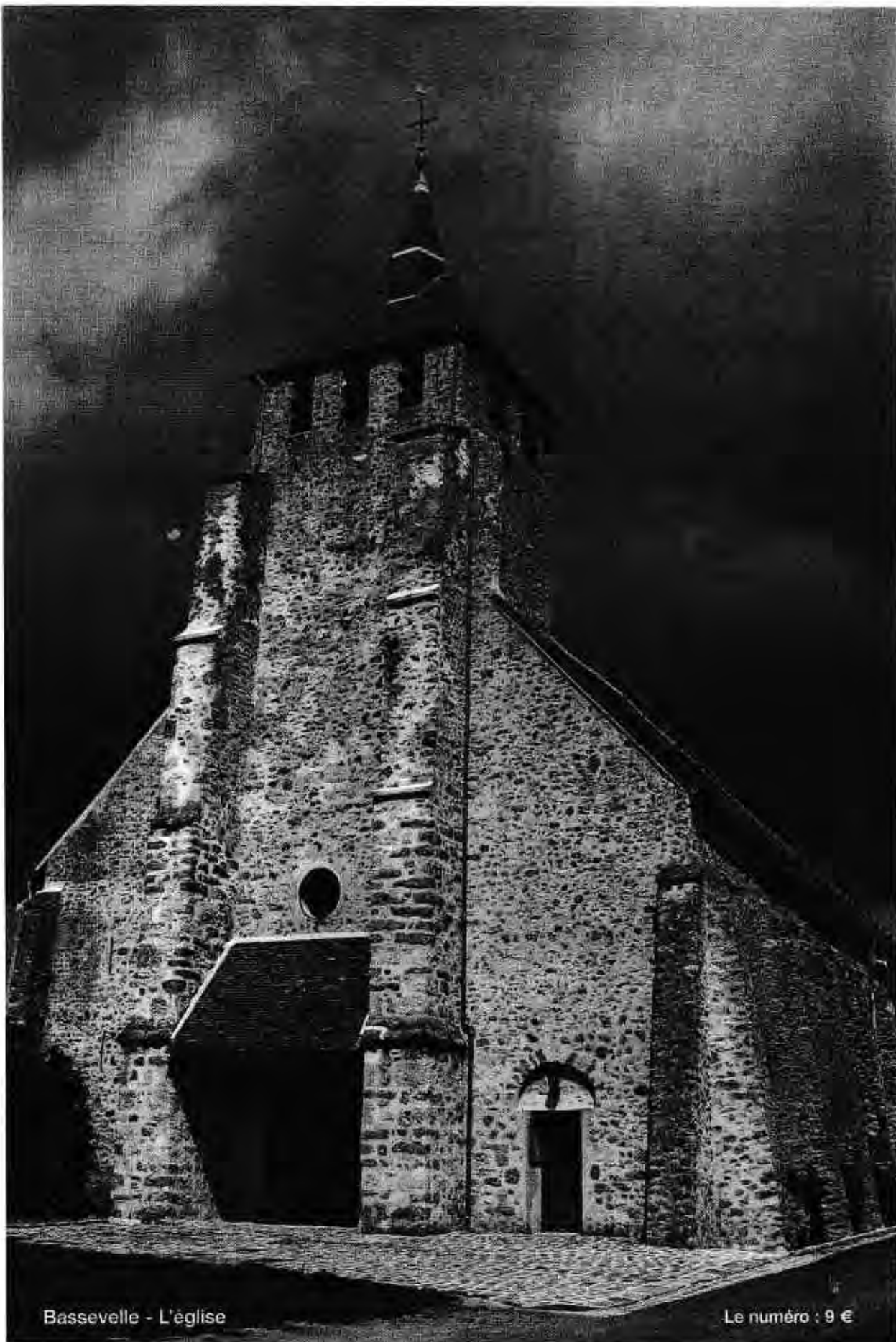
Basseville - L'église