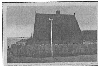
CHAUVIN DE TONNETUIT, PIERRE DE